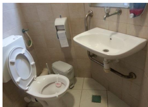
תמונה מס' 5