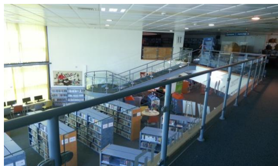
תמונה מס' 1