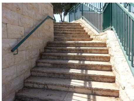
תמונה מס' 4