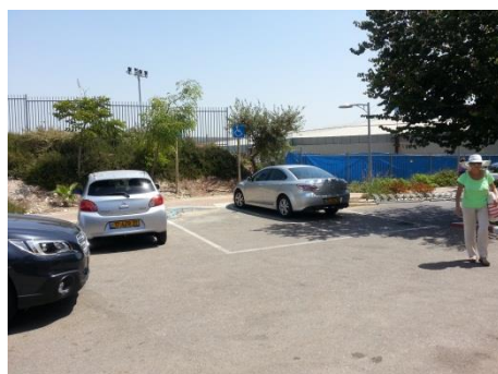
תמונה מס' 6