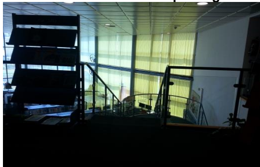
תמונה מס' 2