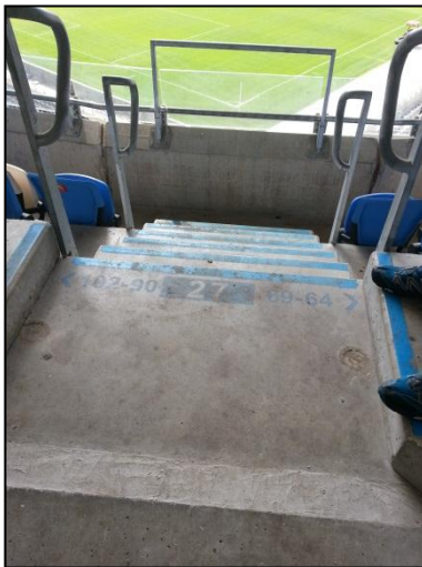
תמונה מס' 5