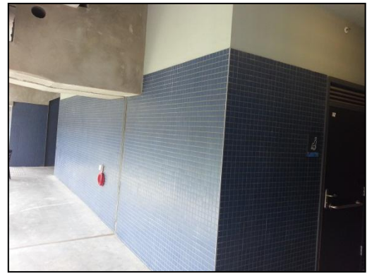
תמונה מס' 1