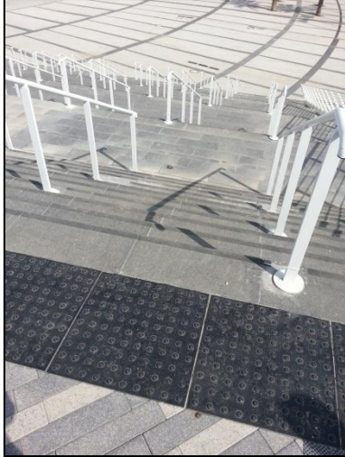
תמונה מס' 2